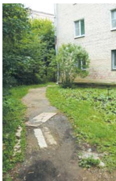
В следующем году предстоит сделать этот тротуар