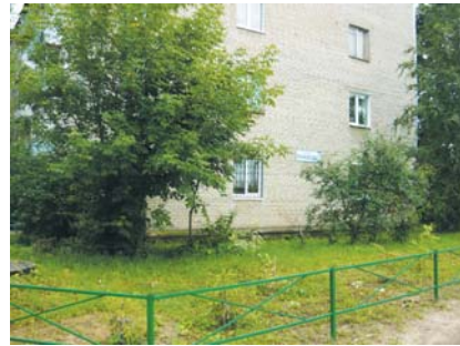
Газоны освободили от поросли.