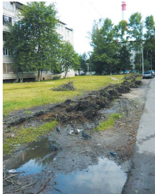
Проблема с автостоянками будет решена полностью.