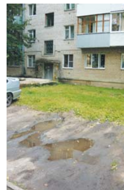
Пр. Строителей, д. 3: стоянку будут расширять.