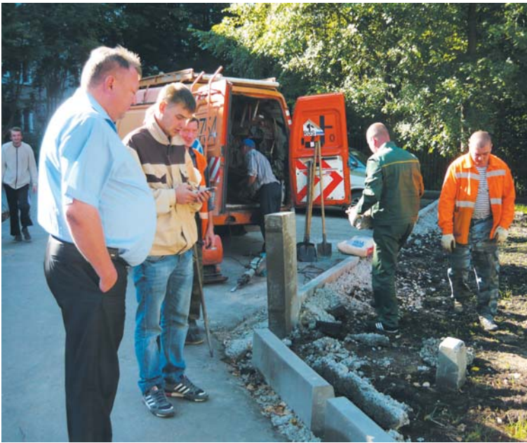
На новый тротуар устанавливаются бордюры - по евростандарту.