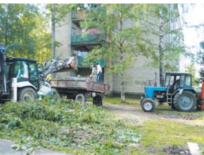
Сухие и больные деревья удалены.