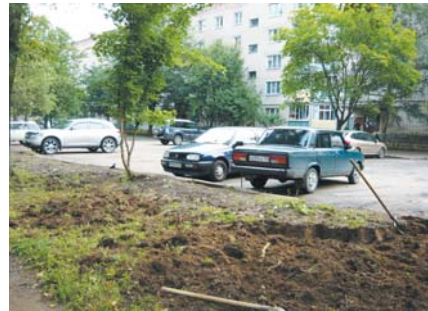
Планировка грунта вокруг автостоянки.