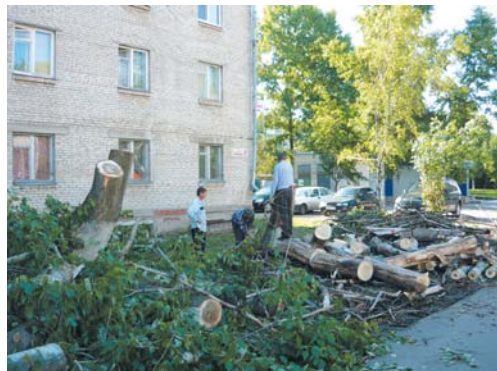
Сухие деревья у д.8 по ул. Черняховского вырубали целый день.