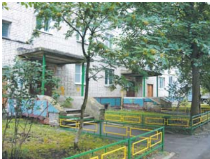
Покрасили ограждения у подъездов, выкосили газоны.