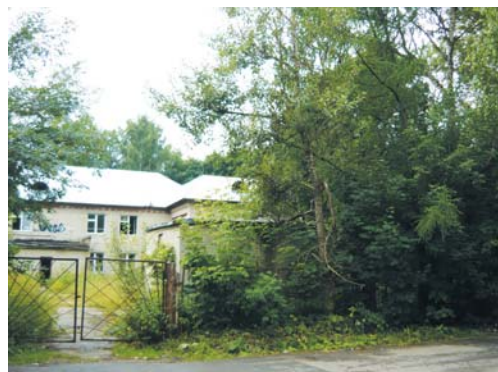
Пришло время навести порядок на территории бывших садилов