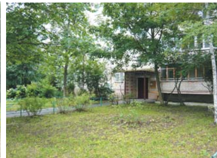
Произвели покос газонов.