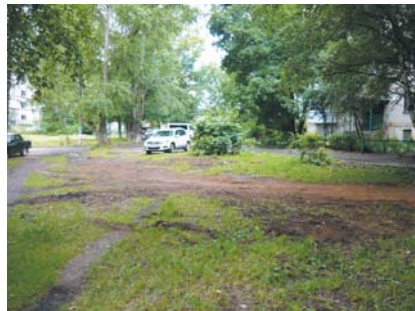
Здесь появится благоустроенная автостоянка.