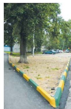
Здесь все вместе осенью посадим клумбу из многолетников.