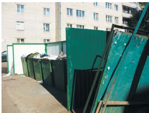
Старое железо на мусорной площадке заменили.