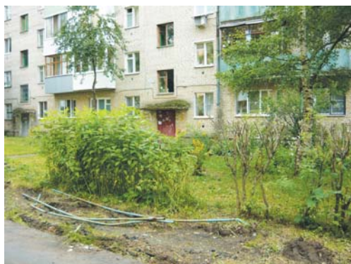
Старые ограждения сняли: нужно расширить стоянку для машин.