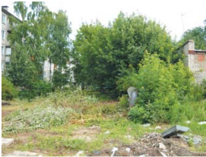
Теплотрасса на въезде в посёлок облагорожена.