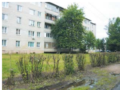
Автостоянка будет расширена.