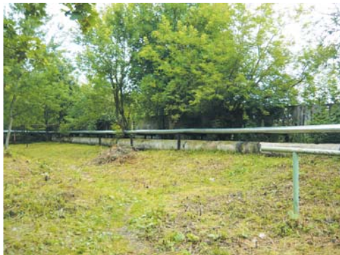
Теплотрассу очистили от поросли и мусора.