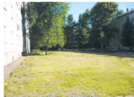
А здесь будут высажены молодые серебристые ивы из питомника.