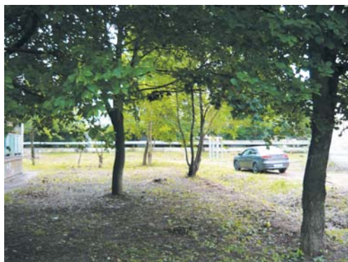
Под окнами д. 9 по ул. Черняховского вырубил всю поросль.